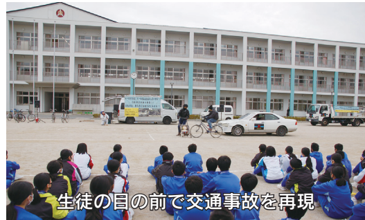
生徒の目の前で交通事故を再現

令和2年11月6日大平中学校において、スケアードストレート方式による交通安全教室が実施されました。