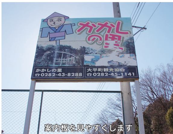
案内板を見やすくします