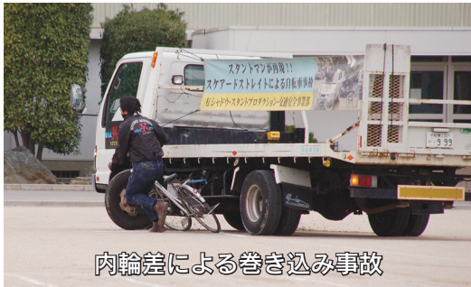
内輪差による巻き込み事故