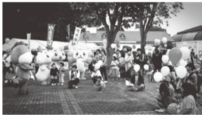
とちぎ協働まつり2014の様子

今年のテーマは「“わくわく”～小さなわくわく、みんなとつながる～」。小さな思いが繋がって起こる素敵で楽しいイベント。みなさんも協働の輪で“わくわく”を広げましょう!