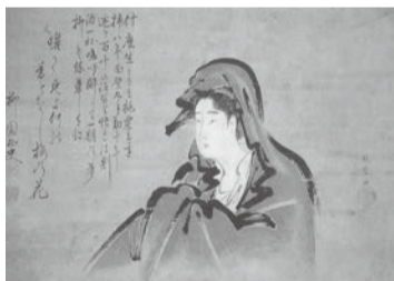
喜多川歌麿《女達磨図》(後期展示) 寛政2~5(1790~93)年 とちぎ蔵の街美術館蔵