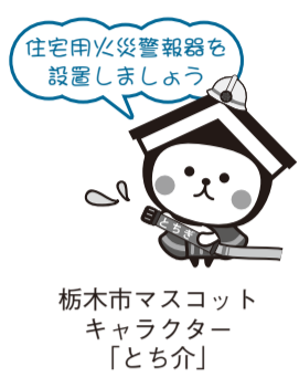
栃木市マスコットキャラクター「とち介」

日時 10月5日(月)10時〜11時45分、13時〜16時 場所 市役所本庁舎3階正庁