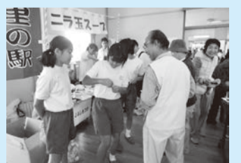
地域の行事に参加する中学生 上に、学校から地域への貢献活動を充実させ、学校と地域が双方向で支援し合うことを重点方針の一つに掲げて努力しているところですが、掲載写真は、中学生が地域の行事にスタッフの一員として参加して、活動の活性化や地域の方との交流、地域に生きる一員としての自覚をもつ機会となるなど、まさに「ふるさと」につながる活動となっております。