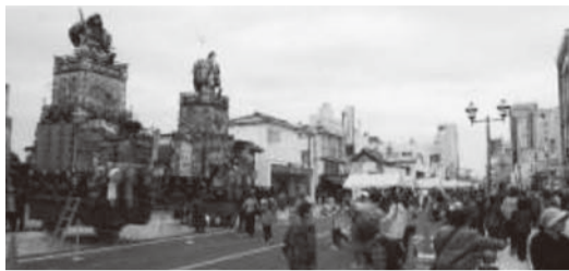
山車会館前に展示された山車

蔵の街大通りにて、物販やPR展示、山車の展示、栃木市の産業と物産展など、秋の各種イベントが盛りだくさん。“とちぎの秋”をお楽しみください。