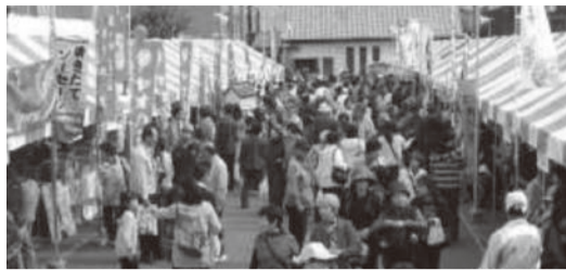
「産業と物産展」の様子