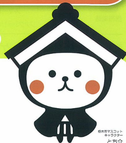
栃木市マスコット キャラクター とち介