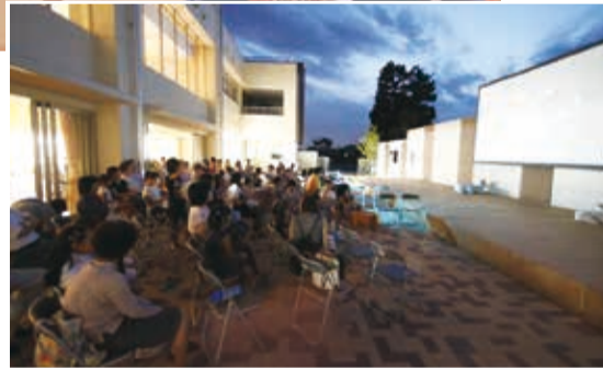
▶ 初めての野外映画会

親子で「わいわい」学校で特別な夏休み 8月11日、大平南小を会場に、子育てママネットのみ、南小おやじの会、地域の方々、白鷺大学の学生、大平南中の生徒たちが「夏休み親子わいわい塾」を開催しました。 参加した親子は、楽しいフォトスタンドづくりやダンス体験、初めての野外映画会など、学校での特別な夏休みを満喫していました。 白鷺大学の学生による交流ゲーム