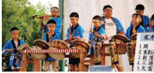
▲ 伝統を受け継いでいる水木はやし