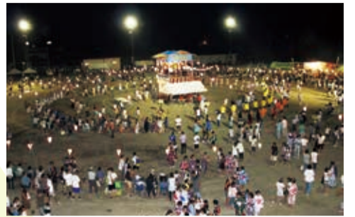
▲ やぐらを中心に盆踊り

都賀の夏祭り! TSUGA盆 8月6日、都賀市民運動場を会場に第42回つが市民盆踊り大会&花火大会「TSUGA盆」が開催されました。 各種団体によるお囃子やフラダンス、よさこいの披露によって幕を開けたオープニングと開会式の後、「TSUGA盆」を象徴する大きなやぐらを中心に来場者はいくつもの輪になって盆踊りを踊り、市民一体となって夏のひとときを過ごしました。 最後には、約2000発の打ち上げ花火が夜空を彩り、本大会を締めくくりました。