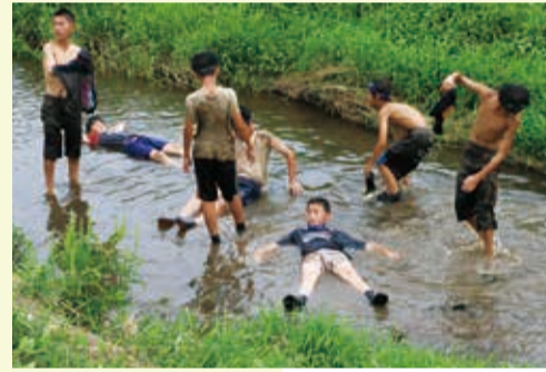
▲ 試合後に川でクールダウン

また、どんごサッカー、フラッグレース、宝探しなども行われ、子どもから大人までどろみれになっていました。