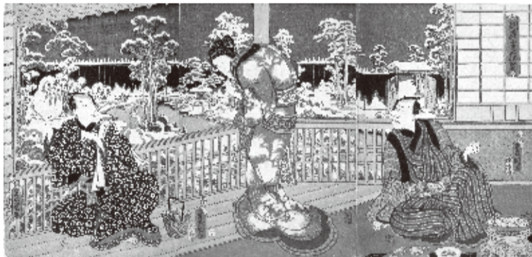
三代歌川豊国《別荘雪見酒盛》安政2(1855)年 浅井コレクション 前期展示