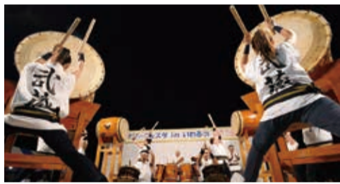
▲ 迫力満点の和太鼓