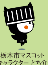
栃木市マスコットキャラクターとち介