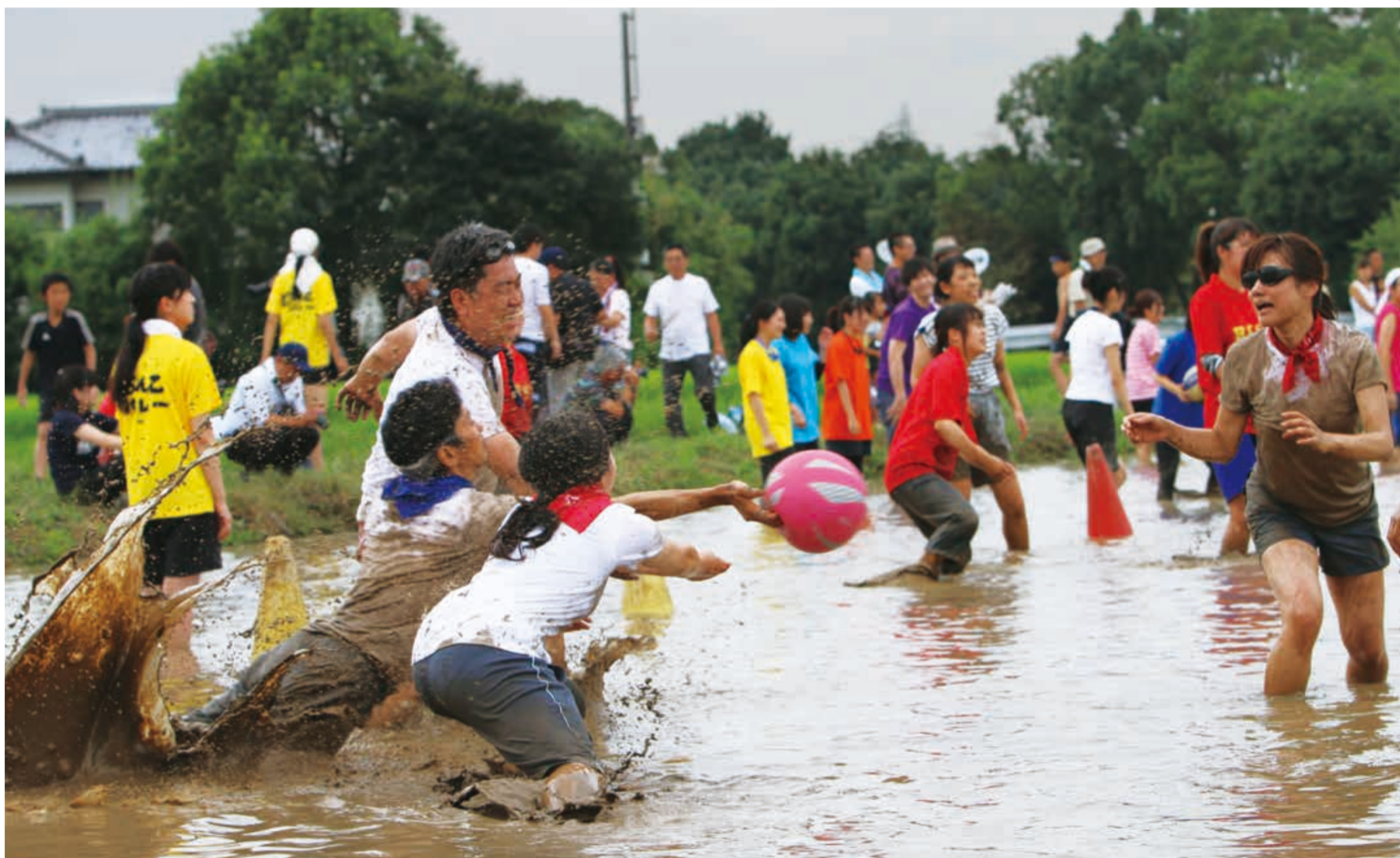
今月の1枚 ボールに飛び込み、どろだらけ (16頁に関連記事)

発行/栃木市 〒328-8686 栃木県栃木市万町9-25 編集/総合政策部シティプロモーション課 ☎0282-21-2316 http://www.city.tochigi.lg.jp