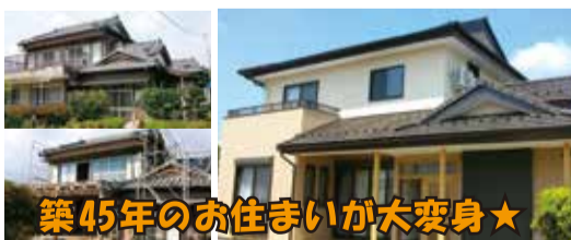
築45年のお住まいが大変身★