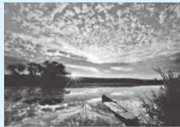
第16回フォトコンテスト最優秀作品