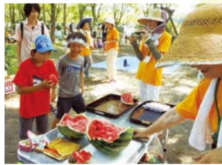
▲ 割ったスイカを頬張る

見事に命中! スイカ割り 8月6日、藤岡渡良瀬運動公園において、家庭教育センターの会となり、家族共催でスイカ割りが行われました。目隠し姿の子どもたちは、「もっと右、もう少し左!」と次々にかかる声を頼りに狙いを定め、見事にスイカが割れると歓声が上がりました。 会場には、ゲームも用意され、訪れた80人の親子連れは、和気あいあいと真夏の交流を楽しみました。