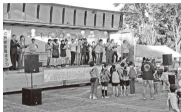
とちぎ協働まつり2015の様子