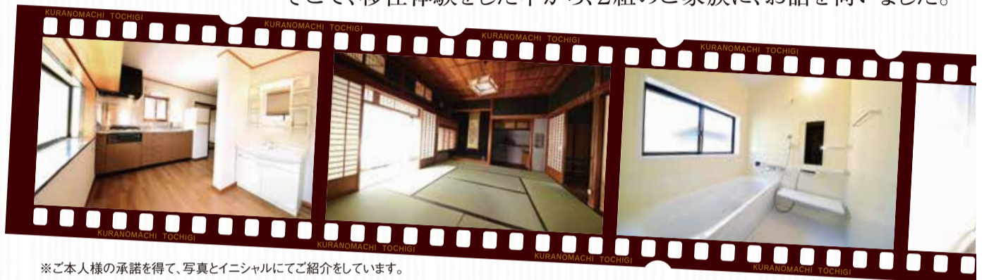
※ご本人様の承諾を得て、写真とイニシャルにてご紹介をしています。

※市内で新生活をはじめのご夫婦を応援する「新婚新生活支援補助金」をはじめました。詳しくは、今月号5頁をご覧ください。