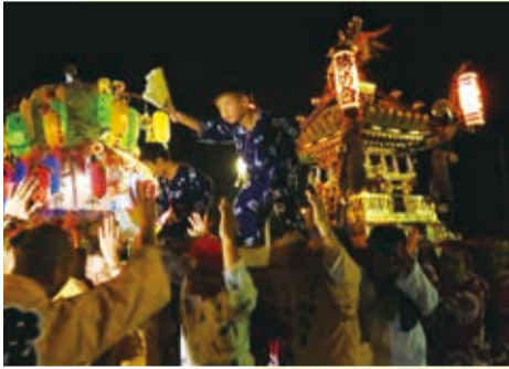
▲ 神輿の登場で祭りの盛り上がりは最高潮に