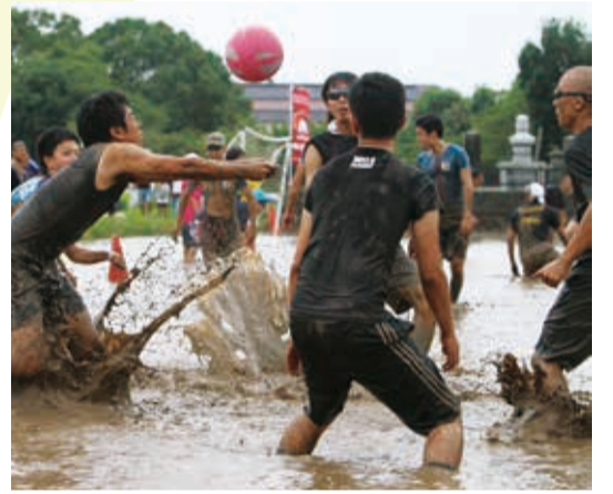
▲ 泥だらけになりながらボールにくらいつく