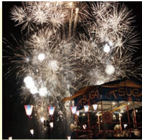
▲ まつりの最後を飾る2000発の花火