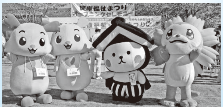
ふっくん・ぴーちゃん、とち介、コスもんも来るよ!

今年のまつりは遊楽々館内で行われる脳年齢測定、肌年齢測定などの健康チェックが充実しています。屋外では園児による発表や飲食などの出店も出ています。 ぜひ、ご参加ください！ 日時 10月16日(日) 9時45分～14時 雨天決行 場所 遊楽々館 (岩舟町三谷) ◆問合せ先 岩舟健康福祉・環境まつり実行委員会事務局 ☎健康増進課内 ☎(25)3511