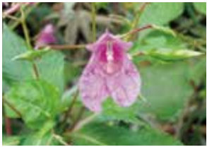
▲ワタラセツリフネソウ

特徴的な形で色鮮やかな花を咲かせるワタラセツリフネソウは、渡良瀬遊水地で唯一「ワタラセ」の名を冠した花です。ツリフネソウ科ツリフネソウ属の新種として、2005年9月に発表されました。一年草のワタラセツリフネソウは毎年、春に種子から芽生えて成長し、秋に開花します。また、実が弾けることで中の種子を飛ばす、という面白い特徴を持っています。丁度この時期が、遊水地で咲く鮮やかな花を見る絶好のチャンスです。