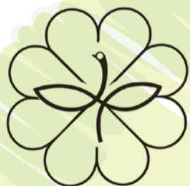
民生委員児童委員シンボルマーク

幸せのシンボルである四つ葉のクローバーの中に、民生委員の「み」の文字と児童委員を示す双葉を組み合わせて、平和のシンボルの鳩をかたどって、愛情と奉仕を表しています。