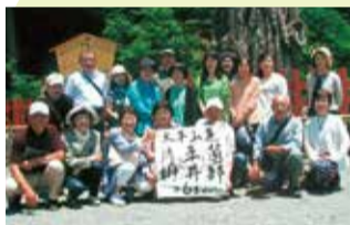
第6区民児協のみなさん

平成23年10月1日の旧西方町との市町合併に伴い、平成24年4月より、連合会に西方地区が加わり、そして平成26年4月5日の旧岩舟町との市町合併と同時に連合会に岩舟地区が加わりました。