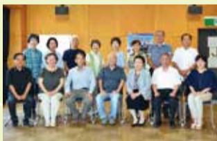
第1区民児協のみなさん

任期は3年で再任も可能。また、民生委員児童委員の活動上知り得た情報については守秘義務が課せられています。この守秘義務は、委員退任後も引き続き課されます。