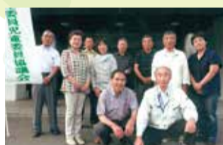
第9区民児協のみなさん