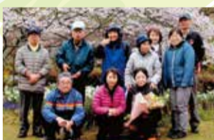
第3区民児協のみなさん

民生委員児童委員は、地域住民である皆さんと同じ立場で相談にのり、必要であれば福祉制度や子育て支援サービスを受けられるように関係機関へつなぐ役割を果たします。