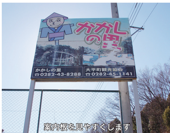
案内板を見やすくします