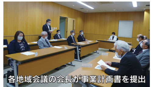
各地域会議の会長が事業計画書を提出

次に、「かかしの里活性化事業」は、大平地域の西山田にある「かかしの里」の施設案内板の修繕や誘導板の新設、施設パンフレットの作成、遊具の修繕などを実施するものです。この施設は、憩いの場や観光拠点としての利用に加え、昨今、NPOなどのまちづくり組織がイベントを開催したり、地域活動の拠点として利用するようになりましたので、この事業を実施することによりまして、今後の施設の利用促進やまちづくり活動の活性化が期待できるものと考えています。