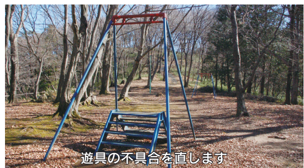
遊具の不具合を直します