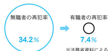
■有職者と無職者の再犯状況の比較(平成21年)

犯してしまった罪をつぐない、社会の一員として立ち直ろうとするには、本人の強い意志や行政機関の働き掛けのみならず、地域社会の理解と協力が不可欠です。我が国では、保護司、更生保護施設を始めとする更生保護ボランティアと呼ばれる人たちの他、更生保護への理解と協力の下、関係機関・団体との幅広い連携によって更生保護は推進されています。