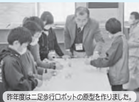
昨年度は二足歩行ロボットの原型を作りました。

昨年度は、機械工学科の先生方にご支援いただき、午前中にものづくりを行い、午後は蒸気機関車への乗車、落雷実験、太陽光発電装置など、施設見学を行いました。 今年度も、ものづくりと学校施設見学のサイエンススクールを親子対象で実施します。