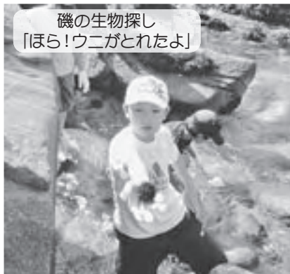
磯の生物探し「ほら！ウニがとれたよ」

持ち物 ウクレレ（持っている方）、筆記用具 申込み 11月5日（金）までに電話で ☎21-2705・2706（土・日・祝日は除く）