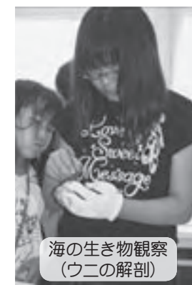
海の生き物観察（ウニの解剖）

物観察を行い、ウニの解剖や生き物の特徴をとらえたスケッチを行うなど、貴重な体験をしました。