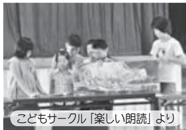
こどもサークル「楽しい朗読」より

栃木公民館は、市民会館の名称で親しまれている建物の中にあり、1・2階部分を所管し、部屋の貸館業務、講座の開催等の業務を行っております。3階部分は女性青少年課所管の働く婦人の家があり、同じ敷地内には栃木勤労青少年ホームや栃木市勤労者体育センターがあるなど中心市街地から少しはずれておりますが、日々いろいろな世代の方が集まり、サークル活動や思い思いの運動を楽しんでいます。