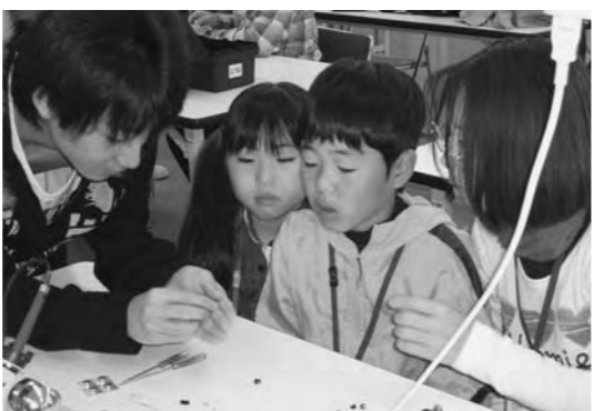
昨年の様子：大学生の支援を受けて光追跡口ポットと綿あめ機を作りました。

「親子でサイエンススクールin日本工業大学」の参加者を募集します。 埼玉県宮代町にある日本工業大学で大学の先生から紙口ポットづくりを学びます。また校内に動態保存されている蒸気機関車に乗りしたり、落雷実験の見学をしたりします。秋の休日に、親子で科学について学びませんか?