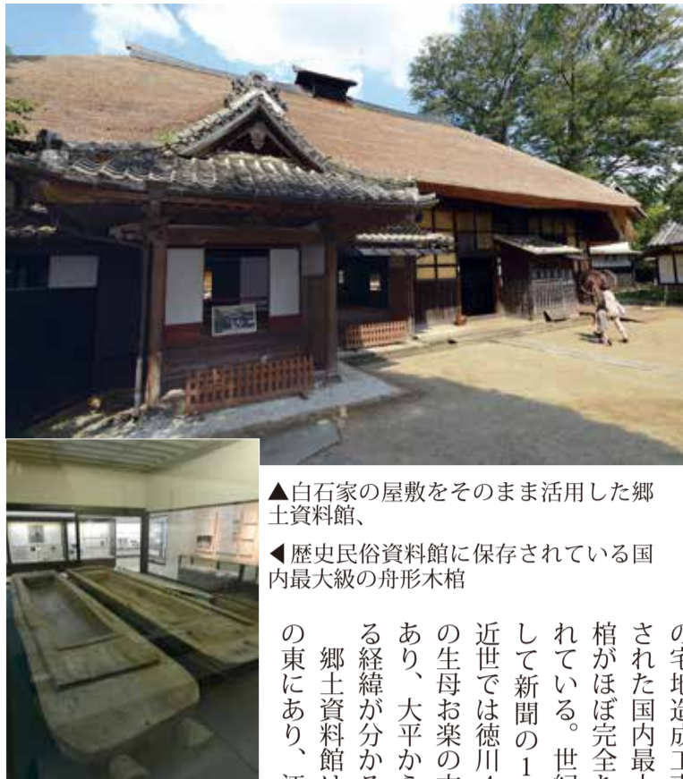
▲白石家の屋敷をそのまま活用した郷土資料館、 ◀歴史民俗資料館に保存されている国内最大級の舟形木棺

太平山の南山麓に展開するブドウ団地のほぼ中央に位置する。隣接する形で一体となって大平地域の歴史を紹介している。歴史民俗資料館は、原始・古代、中世・近世、近現代の宅地造成工事現場で発掘された国内最大級の舟形木棺がほぼ完全な形で保存されている。世紀の大発見として新聞の1面を飾った。近世では徳川4代将軍家綱の生母お楽の方の出身地であり、大平から大奥に上がる経緯が分かる。郷土資料館は民俗資料館の東にあり、江戸時代に一帯の大庄屋を務めた白石家の屋敷をそのまま活用している。明治期には戸長も務めたことから戸長屋敷とも呼ばれる。長屋門や母屋、離れ、蔵など12棟がある。今年萱ぶき屋根をふき替えた母屋には代官を迎える時だけ使用する大玄関があり、大正7(1918)年の陸軍大演習には秩父宮様の宿泊所としても使われた。立派な庭もあり当時の豪農の様子を伝えるところから映画やテレビドラマの撮影場所としても人気が高い。館内では古いスピーカーを使った音楽を楽しむほか、週末などにはポランテアによるお茶のサービスなどもある。