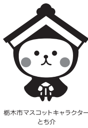
栃木市マスコットキャラクターとちぎ