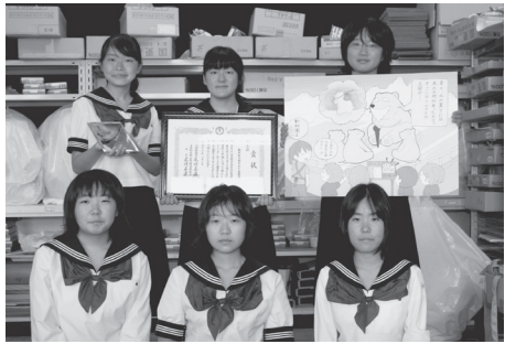
栃木女子高美術部の皆さん

http://mangaoukoku-tosa.jp/articles/page.php?ID=909