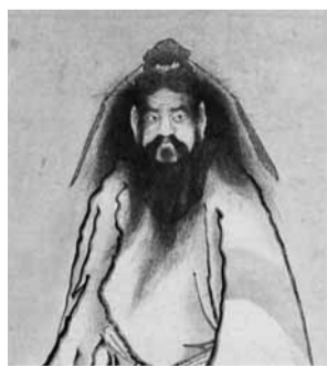
喜多川歌麿 ≪鐘馗図(部分)≫ 栃木市蔵

喜多川歌麿(?～1806)は美人画の大家として知られる江戸時代中期の浮世絵師です。栃木の豪商たちと親交があり、何度か栃木を訪れたと考えられています。歌麿と栃木との関係を長年にわたって研究されてきた故渡辺達也氏所蔵の資料が、昨年市に寄贈されました。本展では渡辺達也コレクションとともに、近年発見された歌麿の肉筆画《女達磨図》《鐘馗図》《三福神の相撲図》と関係資料を中心に、歌麿と栃木の間を探ります。あわせて市所蔵の浮世絵・石川コレクションをご紹介します。