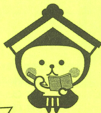
栃木市マスコットキャラクターとち介