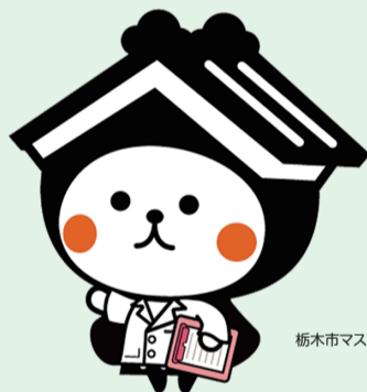
栃木市マスコットキャラクター とち介

受診の方法や集団・個別検診の項目と検査内容、 集団検診会場別日程、その他各種検診について 詳しくまとめました。