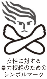
女性に対する暴力をなくす運動のシンボルマーク

近年、社会問題となつてい... 配偶者等からの暴力(ドメスティック・バイオレンス(DV))や、交際中のカッ