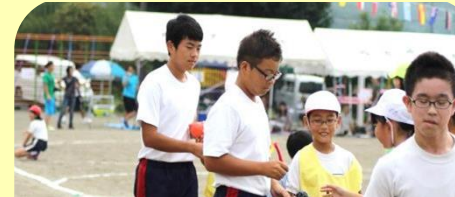
5人の中学生ボランティア! 運動会がスムーズにできました。