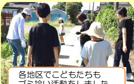
各地区で子どもたちも ゴミ拾い活動をしました。