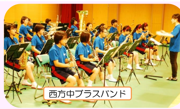
西方中 brass バンド