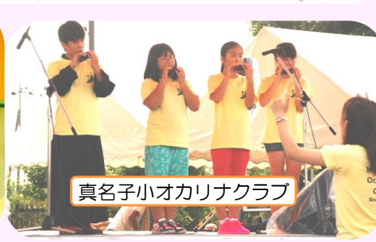
真名子小オカリナクラブ