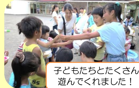
子どもたちとたくさん 遊んでくれました!