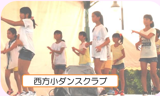
西方小ダンスクラブ