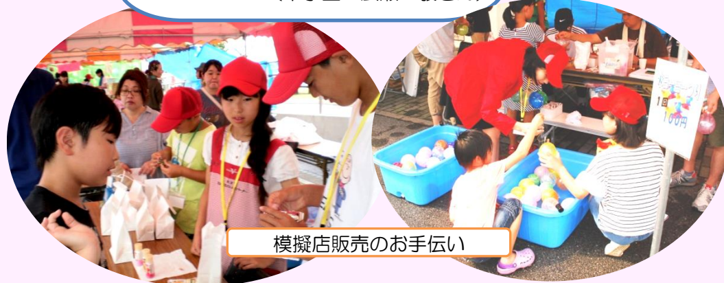
模擬店販売のお手伝い