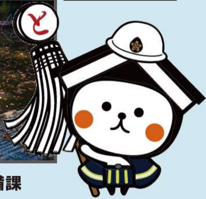
栃木市マスコットキャラクターとち介