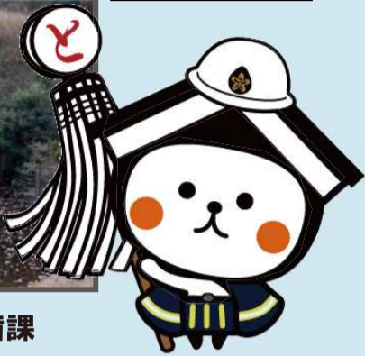
栃木市マスコットキャラクターとち介