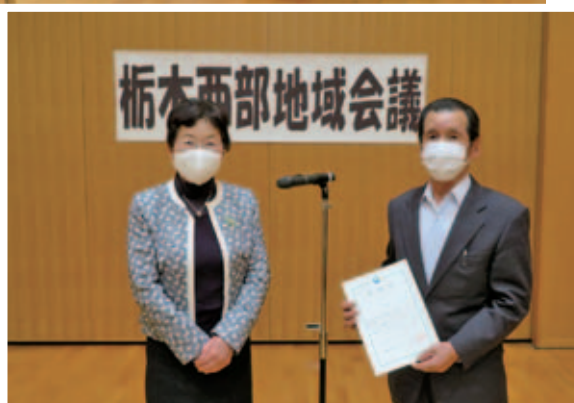
大川市長から全委員に委嘱状が交付されました。

「地域会議」は、地域予算提案制度として地域課題の解決や活性化のための事業計画を策定・提案したり、まちづくりの推進に必要な事項について市長から意見を求められた場合に審議をおこなったりすることで、地域の意見の集約や調整をする役割を担います。