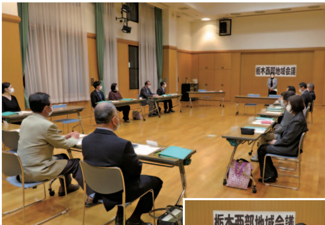
第1回栃木西部地域会議の様子(令和3年4月20日)

令和3年4月20日(火)、吹上公民館大交流室において、第1回栃木西部地域会議が開催されました。