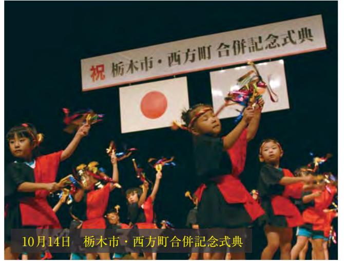
10月14日 栃木市・西方町合併記念式典