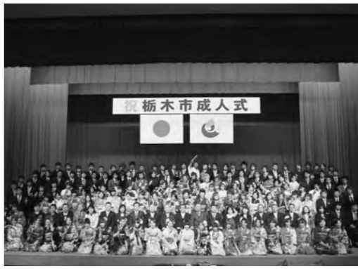
平成23年成人式の様子

平成24年成人式は、平成3年4月2日〜平成4年4月1日生まれの方の成人を祝い、旧市町ごとの会場で実施します。