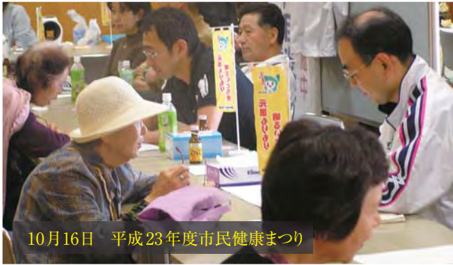
10月16日 平成23年度市民健康まつり