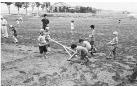
親子塾「農業体験」の様子

問合せ 生涯学習課 (☎)21-2705・2706 mail:gakusyu@city.tochigi.lg.jp