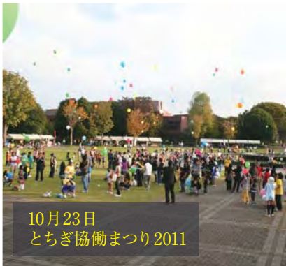
10月23日 とちぎ協働まつり2011