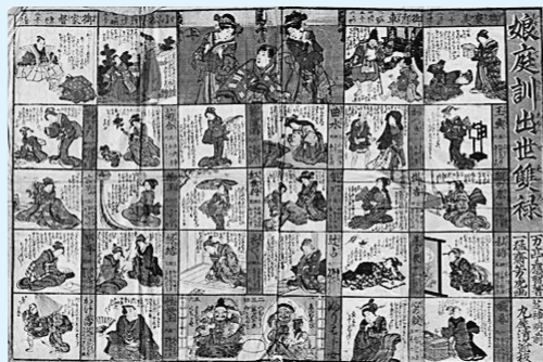
▲《娘庭訓出世双六》