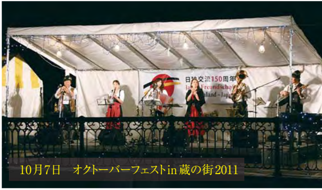
10月7日 オクトーパーフェストin蔵の街2011