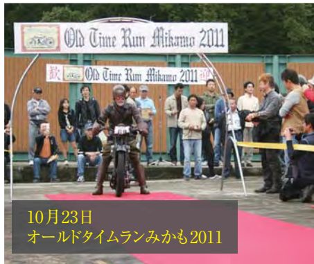
10月23日 オールドタイムランみかも2011