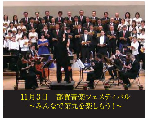
11月3日 都賀音楽フェスティバル ~みんなで第九を楽しもう!~