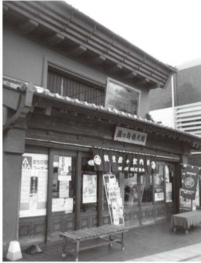
本 商工観光課 ☎21-2543 栃木市観光協会(倭町) ☎25-2356

◆申込み 12月7日(金)までに企画書(事業計画書) 資金計画書等、募集要項に定める必要書類を添えて栃木市観光協会へ。募集要項は商工観光課及び観光協会にあります。