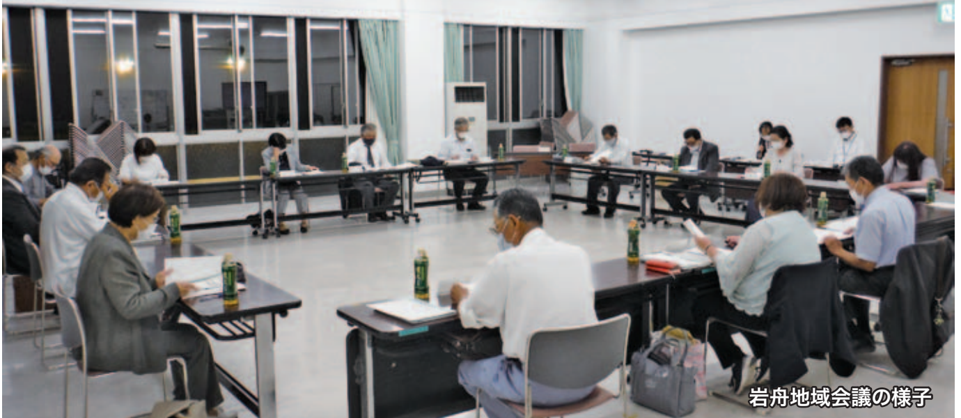
岩舟地域会議の様子