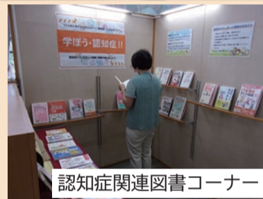
認知症関連図書コーナー