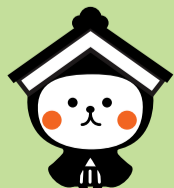
栃木市マスコットキャラクター「とち介」