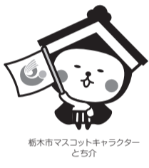
栃本市マスコットキャラクターとちぎ