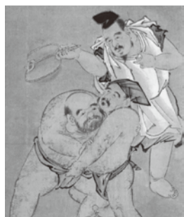
喜多川歌麿 《三福神の相撲図(部分)》 栃木市蔵

※身体障害者手帳、療育手帳、精神障害者保健福祉手帳の交付を受けている方と介護者1名、未就学児無料 ※団体は20人以上