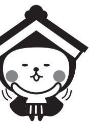
栃木市 マスコットキャラクター とちぎ