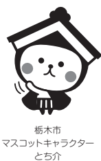
栃木市マスコットキャラクターとちぎ

75歳の誕生日から、それまでの健康保険を抜けて後期高齢者医療制度に移ります。75歳の誕生日前に『後期高齢者医療被保険者証』を郵送します。保険料の通知は誕生月の翌月以降に郵送します。 ◆問合先 本 保険医療課 ☎(21) 2137