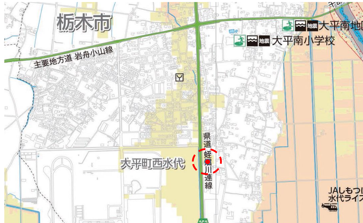
防災ハザードマップ2019年度版抜粋