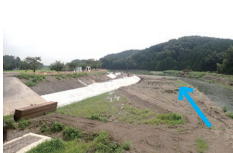
大砂橋下流の施工状況（8/25 時点）