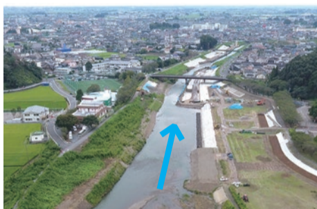
緑地公園前の施工状況（8/31 時点）

巴波川 浸水対策の問合せ先 栃木県栃木土木事務所 ☎ (23) 3434 https://www.pref.tochigi.lg.jp/h55/