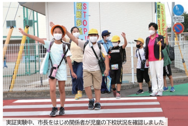
実証実験中、市長をはじめ関係者が児童の下校状況を確認しました