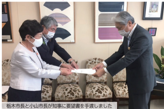
栃木市長と小山市長が知事に要望書を手渡しました