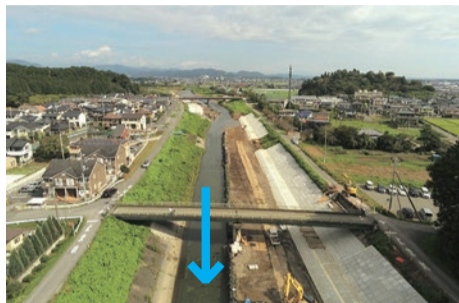
高橋上流の施工状況（8/26 時点）

工事期間中、地域の皆様にはご不便をおかけしますが、早期復旧へのご協力をお願いいたします。