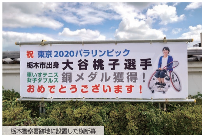
栃木警察署跡地に設置した横断幕