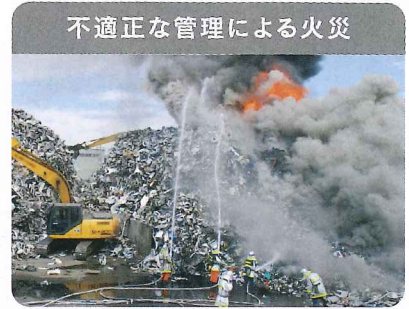
不適正な管理による火災

廃家電は電池やプラスチックを含む ため、発火・延焼の危険性があり、 不適正な管理による火災が発生 しています。