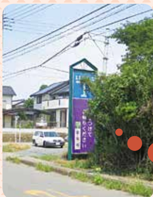
▲看板周囲の状況（幡張地内）