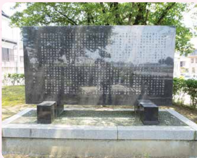
▲「銅像脇に設置されている顕彰碑」 田中正造翁の出生から死去までが刻まれており、訪れる見学者にとって価値が高い。