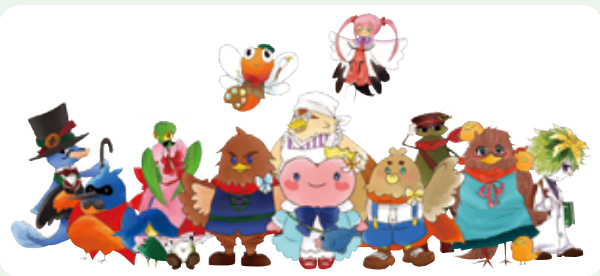
渡良瀬遊水地キャラクター

渡良瀬遊水地のキャラクターには、イベント等でおなじみのHearts 姫（ハーツひめ）やWatarase712（わたらせナイツ）の他に、たくさんの仲間がいます。