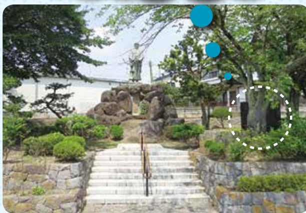
▲「田中正造翁銅像」 藤岡文化会館正面駐車場県道沿いに設置されている。