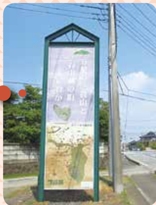
▲看板表面の様子（新波地内）