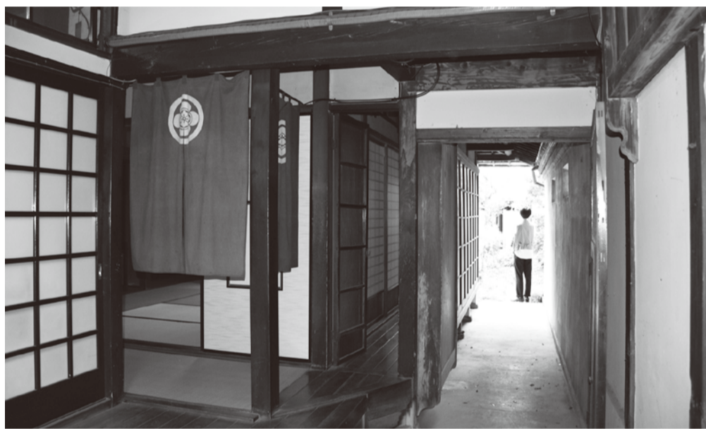
「旧関根邸」内部の様子