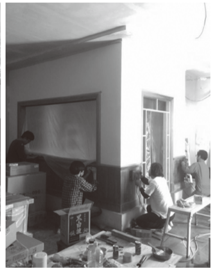
オープンに向けた改装作業