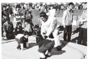
田んぼ相撲の様子

子ども参加型の「田んぼ相撲」をはじめ、大人も参加できる「俵飛ばし」、「トラクター試乗」などイベント盛りだくさん！パフォーマンスステージや豪華景品の当たる大抽選会もあり、家族みんなで楽しめられます。道の駅の「うら」に集まれ！