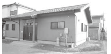
祝町自治会公民館

祝町自治会では自治会活動の拠点施設として自治会公民館を建設しました。今後は公民館を拠点に自治会活動がより活発に行われ、住民間相互の連携・協力のもと、よりよい地域づくりが行われる効果が期待されます。