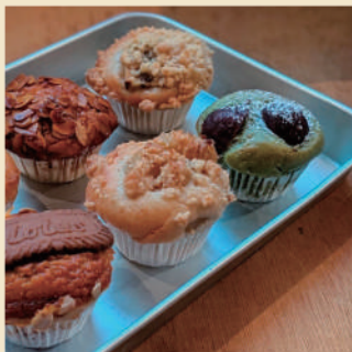
spica cafe +bake -ドリンク・焼き菓子-