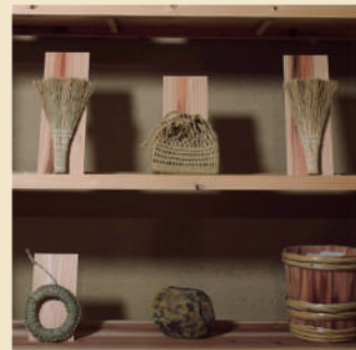
山々と星々/パーラートチギ -生活道具等-