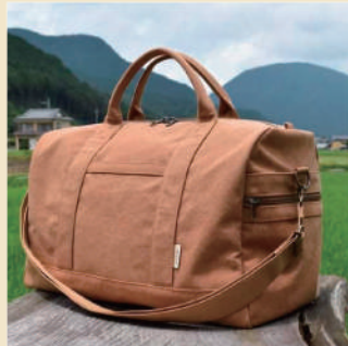
いちひこ帆布 -バック-