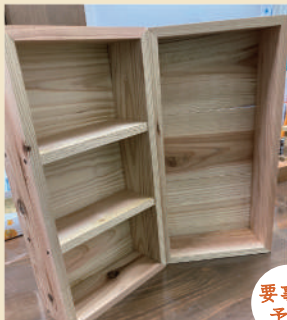
田村住建 -木エワークショップ- 下記のQRコードから予約可能!