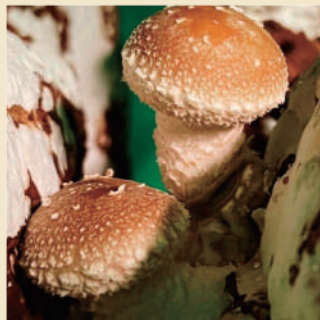
清水商店 -きのこ類-