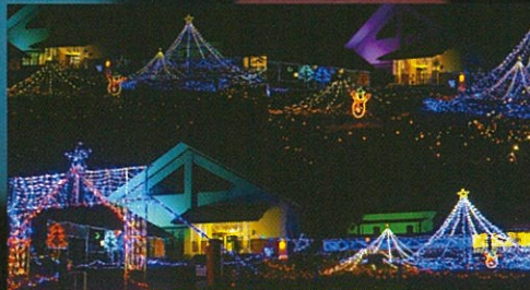
歴史民族資料館前庭