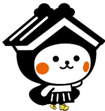
栃木市マスコットキャラクターとち介

※天候や工事等の道路事情により足場が悪い場合がありますので、気をつけながらお楽しみください。