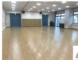
集会所棟 多目的ホール

〒322-0606 栃木市西方町本城2-1 / http://tochigi-hwc.com