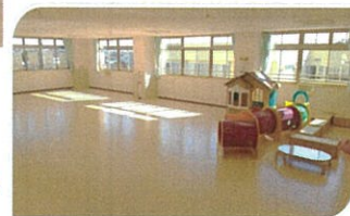
集会所棟 プレイルーム