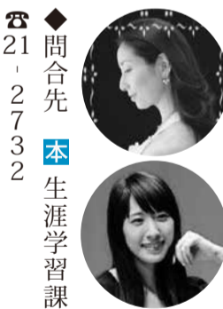
◆問合せ先 本 生涯学習課☎21-2732

連祥院六角堂の本尊で鎌倉時代の作である県指定文化財「木造虚空蔵菩薩坐像」の御開帳に合わせて一般公開を行います。 ◆日時 1月1日(水) 7時~18時、2日(木)~5日(日) 8時~17時 ◆場所 太平山の連祥院六角堂(平井町) ◆参加費 無料 ◆問合せ先 六角堂☎25-31023 / 本 文化課☎20-1089