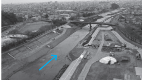
千部橋下流の施工状況（10月時点）