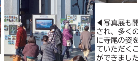
◀写真展も開催され、多くの方に寺尾の姿を見ていただくことができました