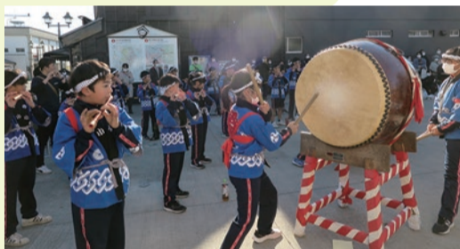
▲寺尾小学校の児童によるお雛子

12月4日、栃本市山車会館前広場にて、「寺尾地区」をPRするイベント『テラオ「キッカケ」マルシェ』が開催されました。寺尾地区の事業者やゆかりのある皆さんが集まり、食事の提供や物販を行ったり、お雛子や写真展などが行われました。イベント開始早々に売り切れてしまう店も出るほどの盛況で、多くの方たちに寺尾を知ってもらう「キッカケ」となりました。