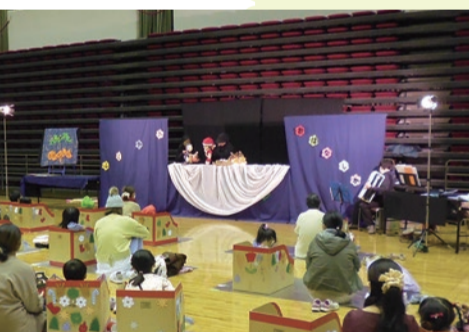
◀みんなで人形劇鑑賞