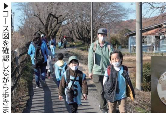
▶コース図を確認しながら歩きます