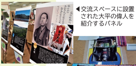
◀交流スペースに設置された大平の偉人を紹介するパネル