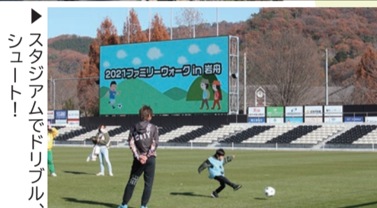
▶スタジアムでドリブル、シュート!

2021ファミリーウォークin岩舟 12月5日、「2021ファミリーウォークin岩舟」が各種団体や中学生ボランティアの協力により、小野寺地区で開催されました。20組64名の家族が参加し、快晴の空の下、約5kmのコースを歩きました。 また、栃木シティフットボールクラブの協力により、スタジアムでサッカー体験をするなど、岩舟の豊かな自然と新たな魅力を発見・体感しました。