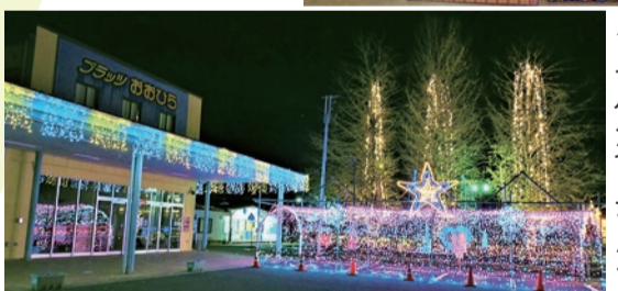
◀冬の夜空を彩るイルミネーション

にぎわいのプラッツおおひら 12月初旬から1月上旬にかけて、大平わいわいテラス主催の「第2回おおひら世間遺産パネル展」が開催されました。大平地域の「誰かに伝えたい」「後世に残したい人・モノ・風景」がパネルになって展示されました。大平地域の魅力、可能性が詰まったパネル展でした。併せて同時期に、大平の冬の風物詩「光と音のページェント」も開催されていました。 大平地域の情報発信基地としての一面を持つ、まちづくり交流センター「プラッツおおひら」の師走の「コマです」。