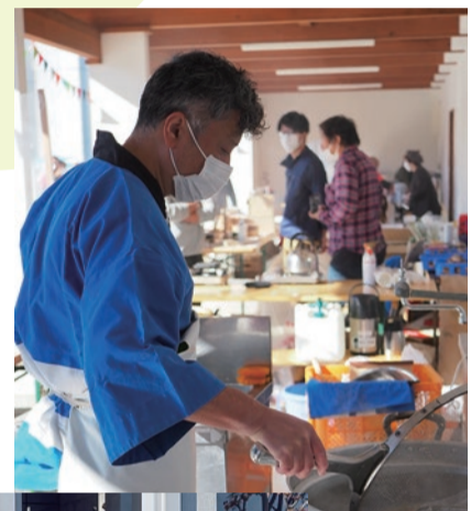
◀寺尾と言えは出流そば!