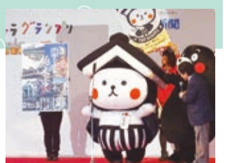
▲最終順位発表の様子(ゆるキャラグランプリ2015にて)

ゆるキャラ®グランプリ2015において、とち介が第6位を獲得しました! 3カ月もの長きにわたったインターネット投票および11月21日～23日に静岡県浜松市にて行われた決戦投票までの間、とち介を応援していただき本当にありがとうございました。全国約1730ものキャラクターがエントリーする中、おかげさまで昨年より2つ順位を上げると共に、目標であった県内第1位を獲得することができました。とち介はこれからも、皆さんからの声援を受けながら、栃木市のPRに努めていきます。