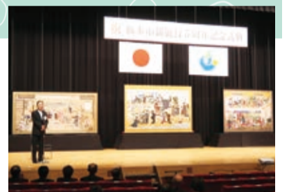
▲市制施行5周年記念式典での初披露の様子