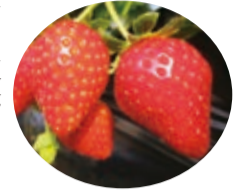
季節ごとに、いちご、ブルーベリー、ぶどう、梨、トマトなど、年間を通してさまざまな果実・野菜の摘み取り体験ができます。子供から大人まで楽しく自然にふれあいながら、旬のフルーツを味わうことができます。今の時期はなんといっても、あまーい「いちご」。旬の「とちおとめ」や、甘くてジューシーな「とちひめ」、今話題の高級いちご「スカイベリー」などを求めて、地元の人のみならず、栃木市を訪れる観光客にも気軽に立ち寄れる観光農園として、連日大勢の人で賑わっています。30分摘みだての完熟いちごを楽しめる「いちご狩り」は予約制ですので、事前にお問い合わせください。

「いわふねフルーツパーク」(55) 5008)は、三轟山の麓にあり、東京からも日帰り遊びに来ることが出来ます。