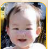
わたなべ りかり 渡辺 縁 ちゃん

平成27年の元旦。この日渡良瀬遊水地にて、初めてナベツルの飛来が確認されました。ツル科のこの鳥は、越冬のために日本にやってくる冬鳥です。身体全体は灰黒色ですが、頭部と首は真っ白、目先や額は真っ黒、頭頂の一部は赤色という、独特の容姿を持っています。近年は個体数の減少により、環境省レッドリスト(絶滅危惧Ⅱ類)に指定されています。