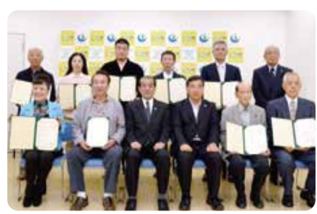
栃木市文化マイスターとして認定された皆さん