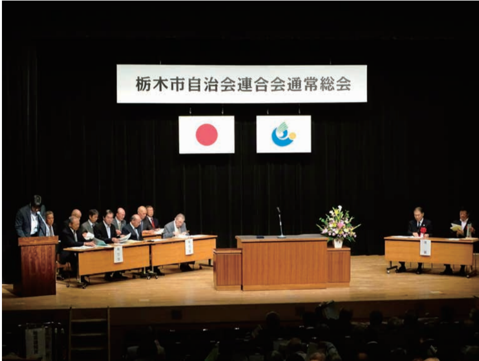
栃木市自治会連合会通常総会