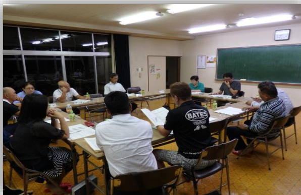
協議の様子 地元代表協議会での