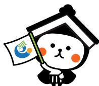
栃木市マスコットキャラクター とち介