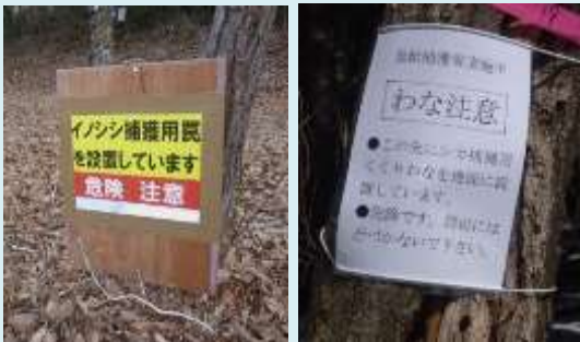
【 注意看板の例 】

注意看板や標識の近くには、「わな」が設置されています。 危険ですので、 絶対に近づかないでください。