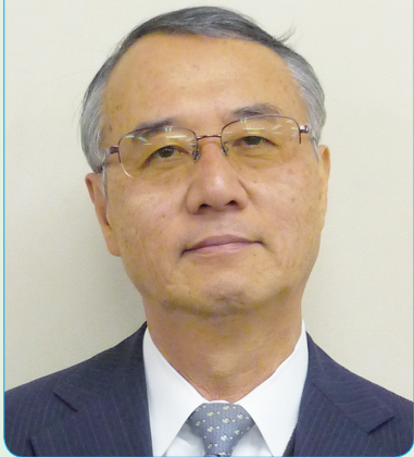
小山工業高等専門学校校長 (建造物保存)