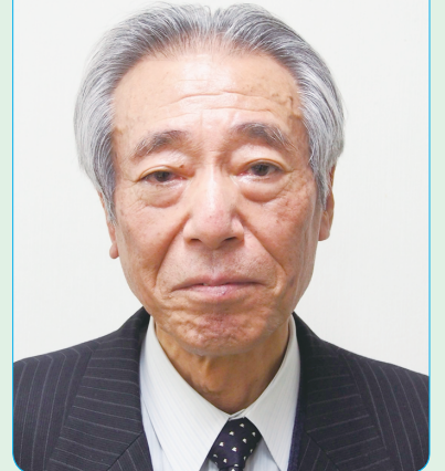
國學院大學栃木短期大学名誉教授 (国文学・民俗学)