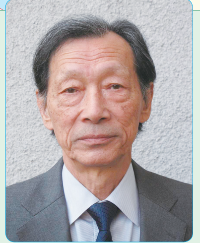
小山工業高等専門学校名誉教授 (文化財保存)