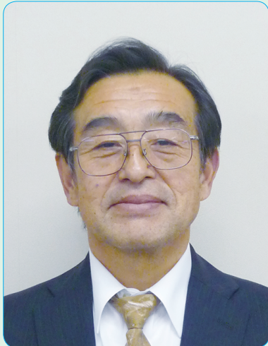
公益財団法人とちぎ未来づくり財団 埋蔵文化財センター副所長 (埋蔵文化財)