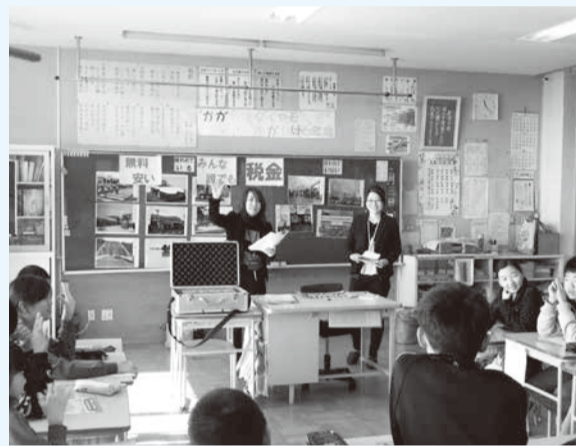
▲12月3日国府南小学校での租税教室の様相

12月3日、国府南小学校で行われた租税教室では、児童たちは「すごいな。これが1億円か！」と1億円のレプリカに興味津々。和やかな雰囲気の中にも、「税金についてあまり興味がなかったが、知ってよかった」「自分たちの周りにこんなに税金が使われているなんて知らなかった」などの感想があり、税金の必要性や使い道に対して関心を持った様子でした。