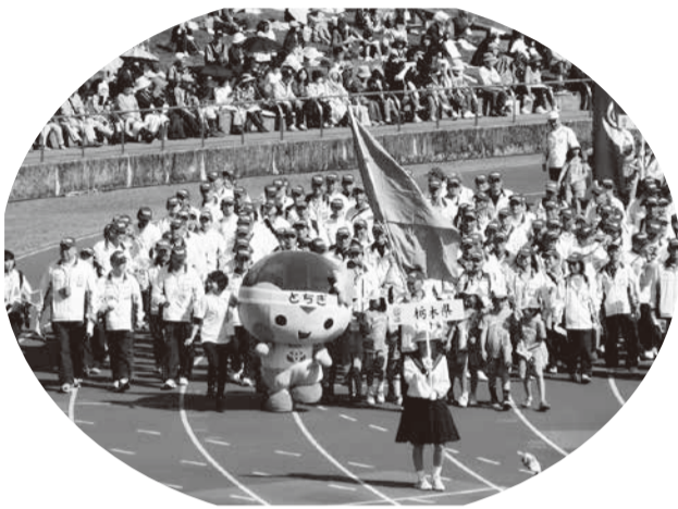
▲よさこい高知2013 入場する本県選手団