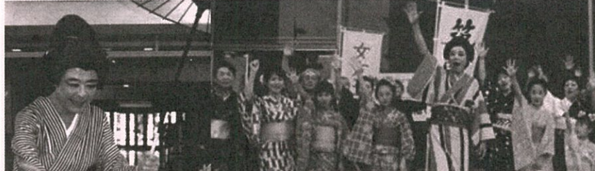
高齢者のアイドル おさかた