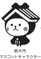
栃木市 マスコットキャラクター とちぎ