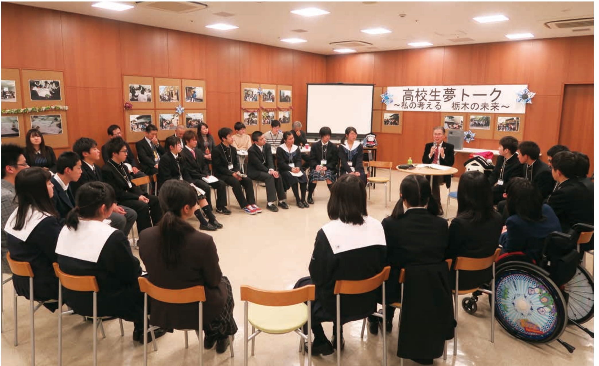
(高校生夢トークにて12月18日撮影)

発行/栃木市 〒328-8686 栃木県栃木市万町9-25 編集/総合政策部シティプロモーション課 ☎0282-21-2316 http://www.city.tochigi.lg.jp