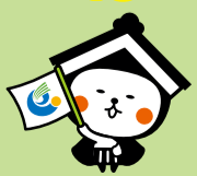
栃木市マスコットキャラクターとちぎ