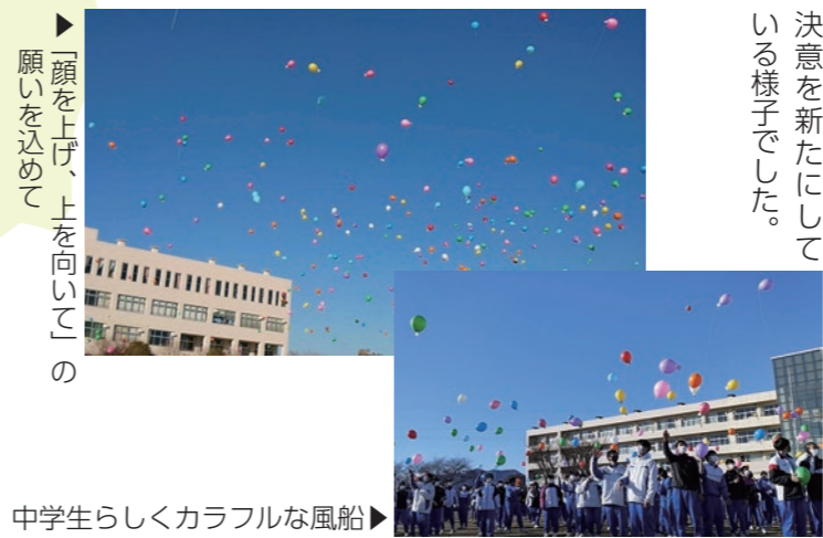
▶中学生らしくカラフルな風船▶

コロナにより多くの制約と共に過ごしてきた生徒の皆さんですが、かけがえのない中学校での思い出を糧に、バルーンを見つめる先にある、それぞれの卒業後の進路を、努力とともに切り拓いていく決意を新たにしている様子でした。