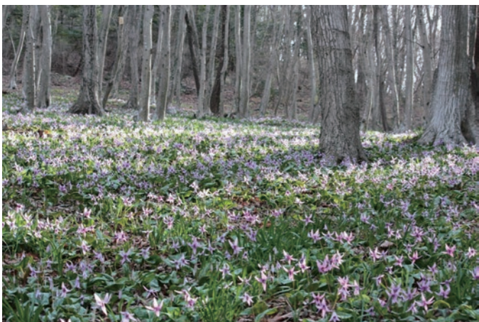
▲紫の花のじゅうたんが広がります

3月中旬から下旬にかけて、みかも山の斜面でカタクリの花の見ごろを迎えます。みかも山東口のカタクリの園では約5万株のカタクリが群生。満開になると薄紫の花が一面に広がり、その光景をカメラに収めようと、多くの来場者でにぎわっています。