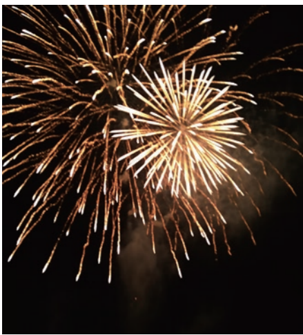
◀夜空いっぱい打ち上げ花火 カウントダウン！▶

3月25日、西方地域内の小中学校を卒業する児童生徒のために、まちづくり実働組織「にしかたわくわく隊」と「にしかた子どもネットワーク」による花火の打ち上げが行われました。西方小学校の6年生3人のカウントダウンを合図に、卒業生のみなさんと保護者の方にお祝いの気持ちを込めて、75発の花火が打ち上げられました。