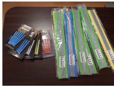
▲新一年生に配布される交通安全グッズ

2月25日、栃木地区交通安全協会都賀支部より、4月から都賀中学校に入学する新一年生に配布する交通安全グッズ（自転車のスポークに取り付ける反射材と、肩から掛けるタスキのセット）が贈呈されました。これは都賀支部独自の取り組みで、自転車に乗る機会が増える中学生の安全のために活用してもらおうと毎年行われています。