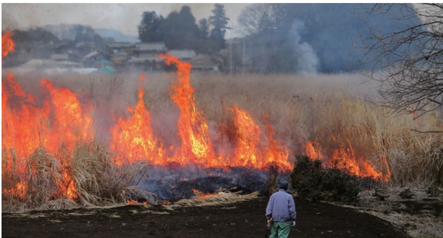
◀炎を上げて燃える枯れ草

2月13日、ふじおか環境保全会が行っている芝焼が、中根地区において実施されました。冬の間、田を覆っている枯草を焼き払うことで、病害虫駆除や豊かな土壌を作るための環境が整います。枯草に火入れすると、パチパチ音を立てながら、あっという間に一帯が燃え広がり、芝焼の煙が立ち上りました。