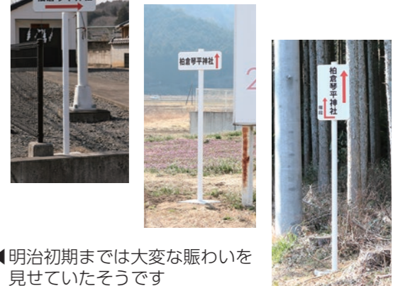
◀明治初期までは大変な賑わいを見せていたそうです